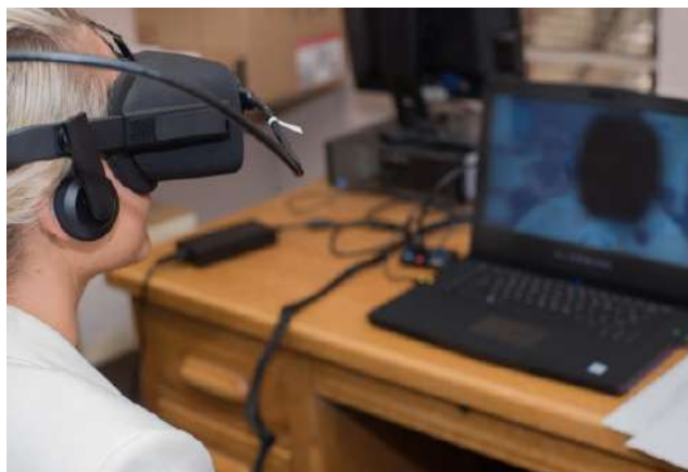
Imagen 1. Recuperado de Degli et al. (2019)

Dentro de este nuevo paradigma educativo, la realidad virtual (RV) ha emergido como una herramienta innovadora con un enorme potencial pedagógico. Según Dyer, Swartzlander y Gugliucci (2018), la RV ofrece experiencias inmersivas que pueden transformar la manera en que los estudiantes aprenden, facilitando la visualización y comprensión de conceptos complejos. Esta tecnología ha comenzado a incluirse en algunos currículos educativos y puede ser accesible a través de diversos dispositivos, como teléfonos móviles, tabletas, ordenadores o equipos especializados (Degli et al., 2019). Esto subraya el papel cada vez más importante de la tecnología en el futuro de la educación.