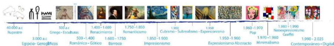
Evolución del garabato - Susana Azcona

El garabato es tan ancestral, como el origen del ser humano. A través de una línea del tiempo podemos observar su evolución.