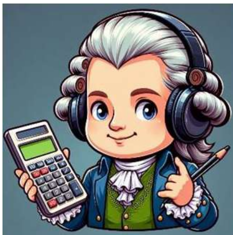
Figura 1: Logo actividad "Sintoniza el intervalo"