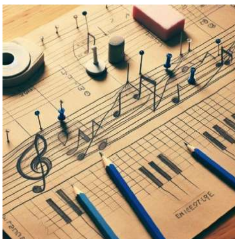
Figura 2: Ejemplo artístico actividad "Partitura cronológica"

Utilizando materiales como gomas, chinchetas y cartón, los estudiantes construirán una línea temporal física en la que realizarán operaciones de unión e intersección de intervalos, representando periodos musicales y eventos clave. Trabajando en grupos, clasificarán acontecimientos como el nacimiento y muerte de compositores, el estreno de obras significativas y la aparición de estilos musicales. Empleando chinchetas de distintos colores, indicarán intervalos abiertos, cerrados y semiabiertos, lo que les ayudará a visualizar la duración y el solapamiento de cada periodo musical y a comprender mejor las operaciones matemáticas involucradas.