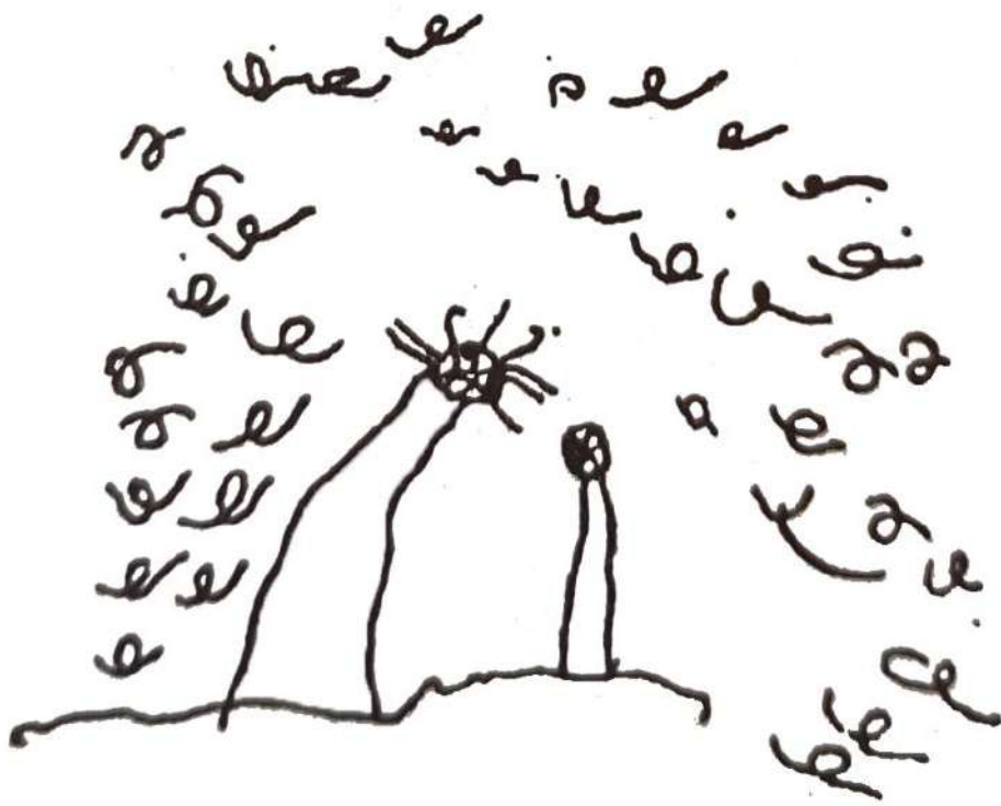
"mamá riñendo a su hijo" – Jacques – El aprendizaje del dibujo